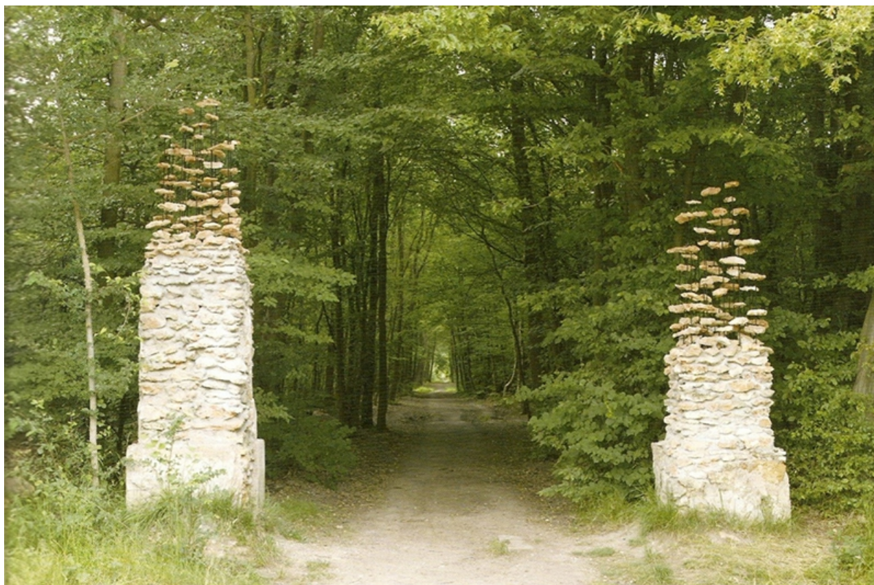
Fot. 21 [reprodukcja referencji archiwum warsztatowego]