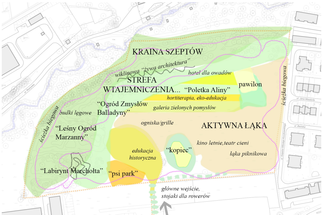
Fot. 20 Schemat parku