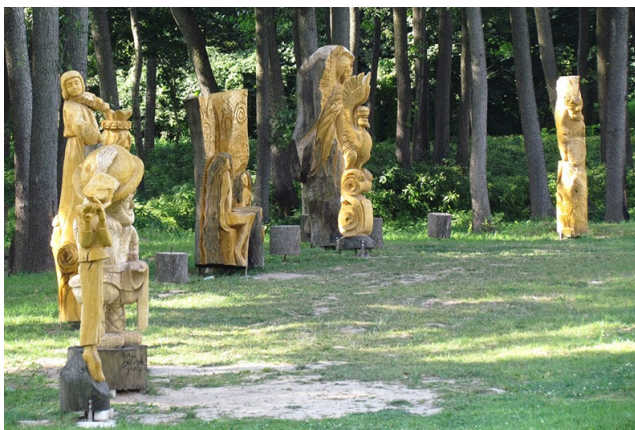
Fot. 17 „Labirynt Marchołta”

Przez wszystkie strefy parku przewija się ścieżka biegowa i nordic walking z „nanizanymi” na nią mini siłowniami (rodzaj ścieżki zdrowia). Pojawia się kilka punktów z toaletami i przewijakami oraz kilka kameralnych placów zabaw dla dzieci w różnym wieku. Wszystko z naturalnych materiałów.