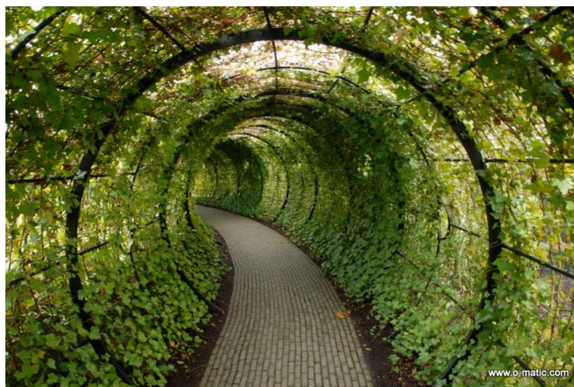
Fot. 2 Tajemniczy, czyli wciągający... [reprodukcja referencji archiwum warsztatowego]