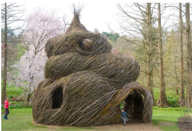
Fot. 16 Tajemnicza architektura z wikliny [reprodukcja referencji archiwum warsztatowego]