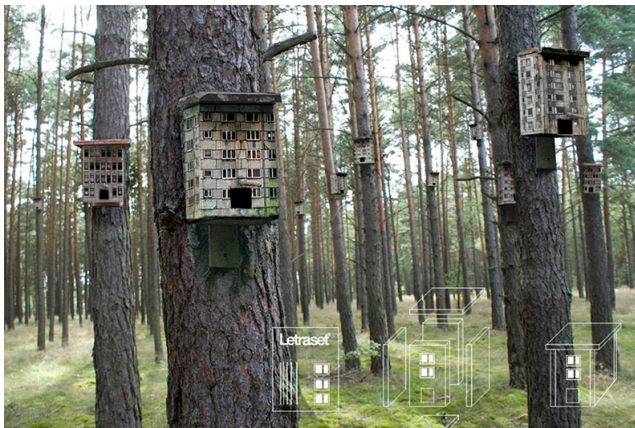
Fot. 14 Budki lęgowe [reprodukcja referencji archiwum warsztatowego]