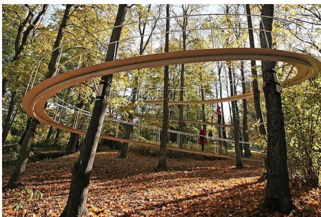
Fot. 15 Taras obserwacyjny [reprodukcja referencji archiwum warsztatowego]