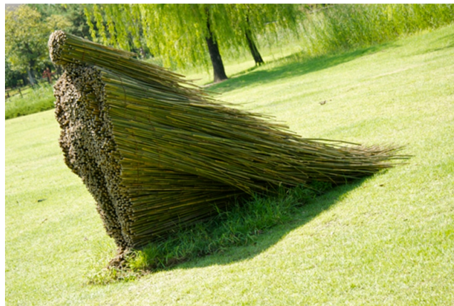
Fot. 5 Tajemniczy, czyli naturalistyczny... [reprodukcja referencji archiwum warsztatowego]

Tajemniczy znaczy także „ rządzony ” przez siły przyrody , naturalistyczny, z budkami lęgowymi dla ptaków, „żywą architekturą” z wikliny oraz permakulturowymi uprawami. To miejsce, w którym ludzka ingerencja objawia się w sposób dyskretny, gdzie na nowo można odkryć więź łączącą człowieka z naturą. Kultura nie jest przeciwstawiona naturze, zaś architektura staje się sztuką symbiozy z otoczeniem.