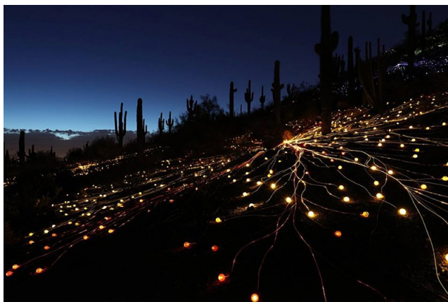
Fot. 6 Tajemniczy, czyli atrakcyjny nocą...

Tajemniczy to również dostępny i atrakcyjny po zmroku , a także o każdej innej porze roku i dnia. Nieoczywiste, „elastyczne” przestrzenie sprawiają, że w Tajemniczym Ogródku zawsze pozostaje coś do odkrycia. Iluminacja roślin z czujnikami ruchu i zasilaniem fotowoltaicznym czy teatr cieni to przykłady wieczornej magii parku.