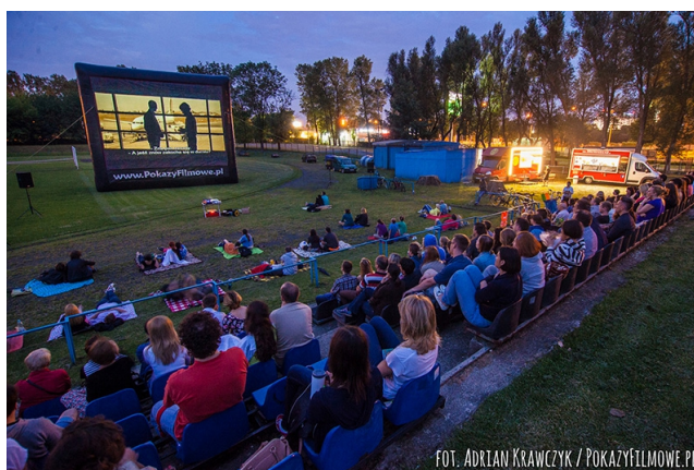
Fot. 7 Kino letnie