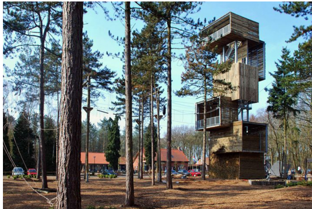
Fot. 9 Wieża widokowa

[reprodukcja referencji archiwum warsztatowego]