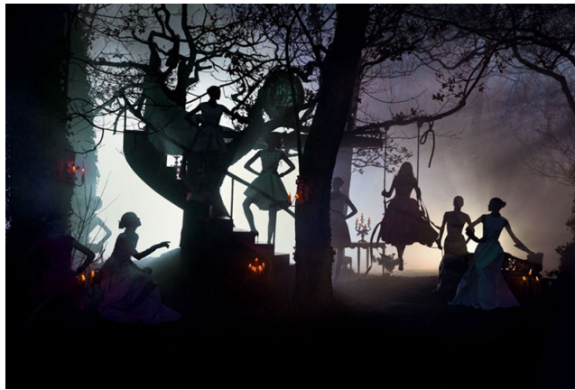
Fot. 8 Teatr cieni

[reprodukcja referencji archiwum warsztatowego]