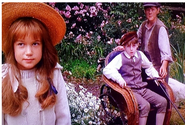
Fot. 3 Tajemniczy, czyli uzdrawiający... [reprodukcja referencji archiwum warsztatowego]

Tajemniczy znaczy także uzdrawiający (tak jak tytułowy ogród w powieści F.H. Burnett) m. in. poprzez zajęcia hortiterapeutyczne , zachęcanie do aktywności na świeżym powietrzu (tj. sport, gry terenowe zamiast komputerowych) czy edukację prozdrowotną (np. ogród ziołowy z opisami leczniczych właściwości roślin). Czerwonoprądnicki Tajemniczy Ogród ma być parkiem pokoleń , w pełni dostępnym dla starszych i niepełnosprawnych – bez ich stygmatyzacji czy „segregacji” grup wiekowych.