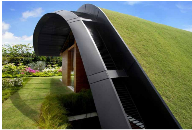
Fot. 10 Pawilon