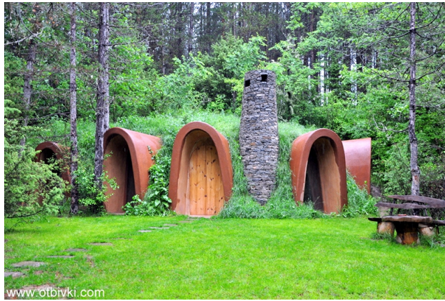
Fot. 12 W stronę natury...

[reprodukcja referencji archiwum warsztatowego]