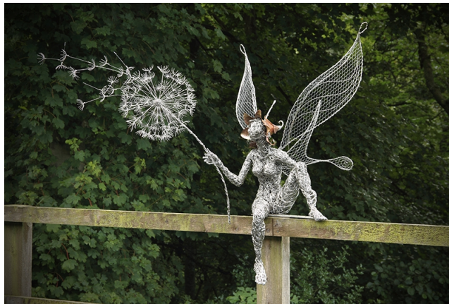
Fot. 4 Tajemniczy, czyli baśniowy... [reprodukcja referencji archiwum warsztatowego]

Tajemniczy znaczy baśniowy , odwołujący się do legend, mitów i literatury. Wokół parku pojawiają się ulice Aliny, Balladyny, Marchołta. Marchołt, bohater apokryficznej opowieści o królu Salomonie oraz dramatu Jana Kasprowicza, to także imię demona z mitologii słowiańskiej. W okolicy istnieje legenda, jakoby teren parku – Wzgórze Czerwonoprądnickie – było kiedyś miejscem jego kultu.