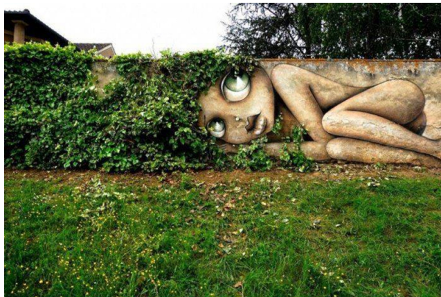
Fot. 13 Garden street art w „Ogrodzie Zmysłów Balladyny”

[reprodukcja referencji archiwum warsztatowego]