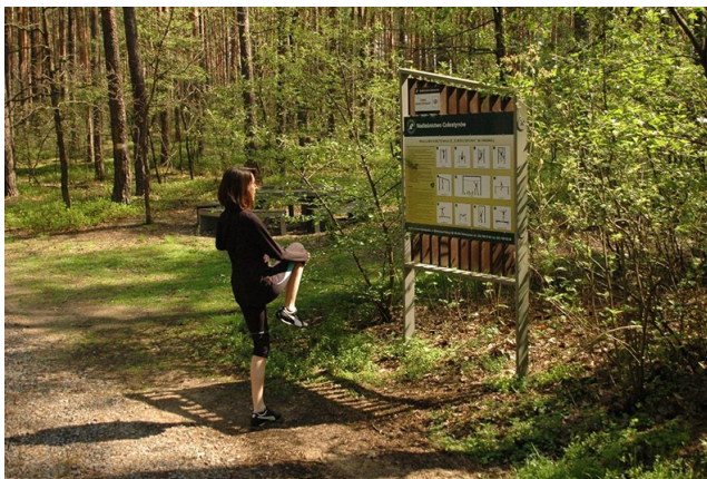
Fot. 18 Ścieżka biegowa [reprodukcja referencji archiwum warsztatowego]

Przez wszystkie strefy parku przewija się ścieżka biegowa i nordic walking z „nanizanymi” na nią mini siłowniami (rodzaj ścieżki zdrowia). Pojawia się kilka punktów z toaletami i przewijakami oraz kilka kameralnych placów zabaw dla dzieci w różnym wieku. Wszystko z naturalnych materiałów.